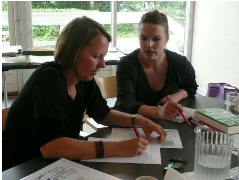
Figur 3. Intenst og godt arbejde i gruppen fra Odder og Vorrevangskolen.