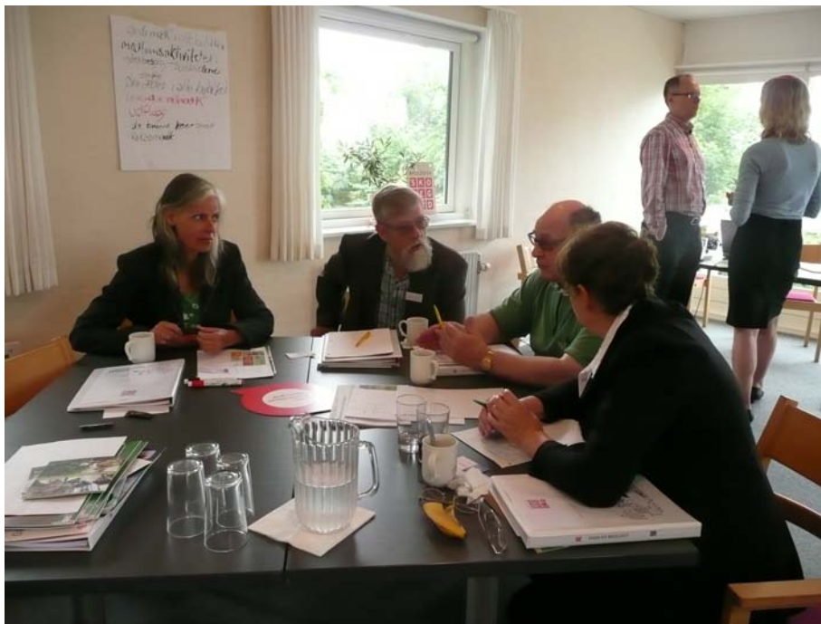
Figur 2. Ebeltoftgruppen i arbejde.

Formidling af viden om økologi til børn og unge var et fælles oplæg fra konsulent Bente Svane, Skolekontakten FDB, og Dorte Ruge, Projekt Økologi i skolen. Deltagerne sad fra starten af kurset i grupper, der var inddelt i forhold til følgende lokalområder ( se næste side):